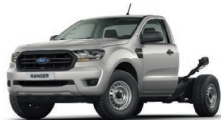
RANGER PODWOZIE Z KABINĄ