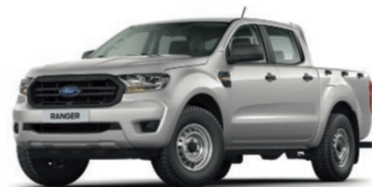
RANGER PODWÓJNA KABINA